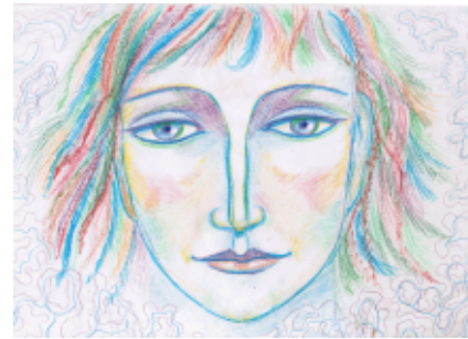
Твоей руки прощальное тепло

Твоей руки прощальное тепло Сознание разлукой обожгло. Автобус, отходящий от платформы, Часов вокзальных черное табло... Твоей руки прощальное тепло – И сердце ожиданием светло. Его глубин заснеженные фьорды Весною грезят грустно и светло. Я приплыву к тебе сказать том Последним – несожжённым! – кораблём. И вновь к моей ладони прикоснется Твоя рука приветливым теплом.