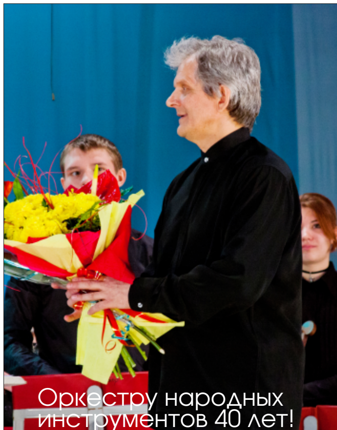
Оркестру народных инструментов 40 лет!